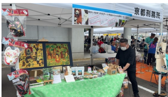
YAMASHINA ARTFES 展示 （08. 05.23）