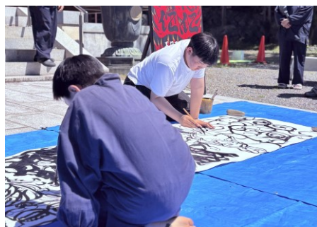
笠原寺 ライブペイント （08. 04.28-5.05）