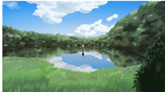
Chapter.2 もりで見つけた宝もの 「森のあなた」